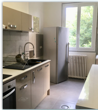
Présentation du Centre Thérapeutique Résidentiel du Trait d'Union - Association Oppedia

D'autres ateliers complètent ces approches (psychomotricité, art thérapie, RDR, activités sportives...).