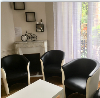
Présentation du Centre Thérapeutique Résidentiel du Trait d'Union - Association Oppedia