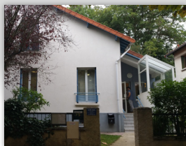
CSAPA de Palaiseau

accueille toute personne (consommateurs et/ou entourage, sans limite d'âge) en difficulté avec une pratique addictive, quel qu'en soit l'objet.